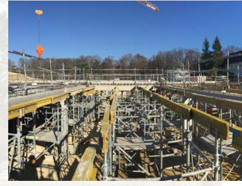
Mise en place des prédalles - 27/02/2019