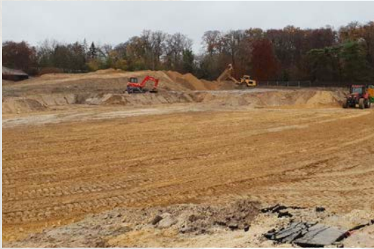
Traitement de plateforme - 06/12/2018