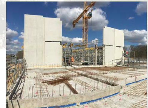
Premiers prémurs mis en place - 19/03/2019