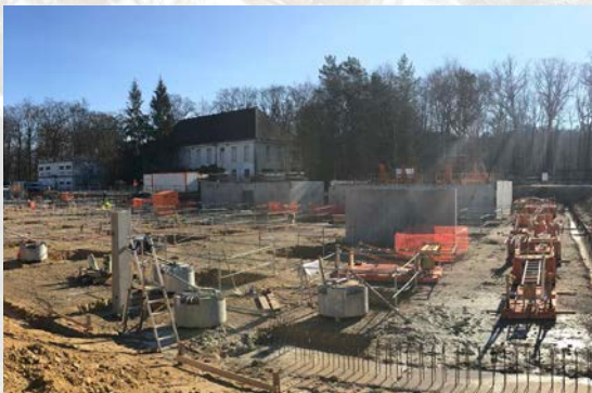
Pose des poteaux du sous-sol - 5/02/2019