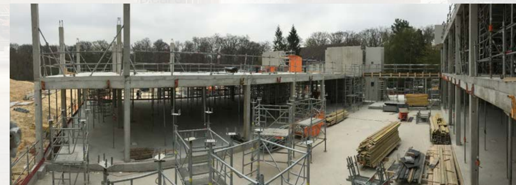
Pose des poteaux R+1- 10/04/2019