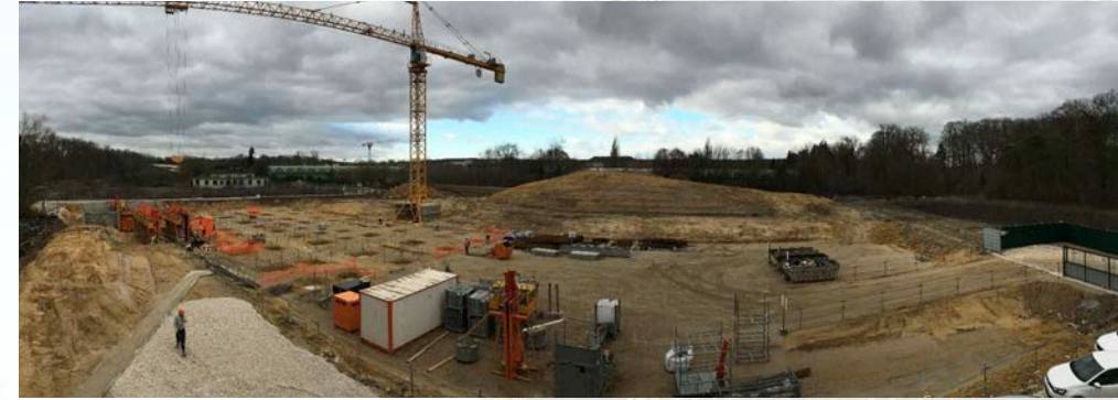
Vue d'ensemble, voiles sous-sol à 80% - 28/01/2019