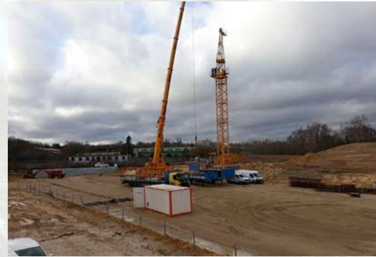
Montage de la grue - 20/12/2018