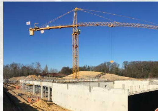
Vue du local Archives - 15/02/2019