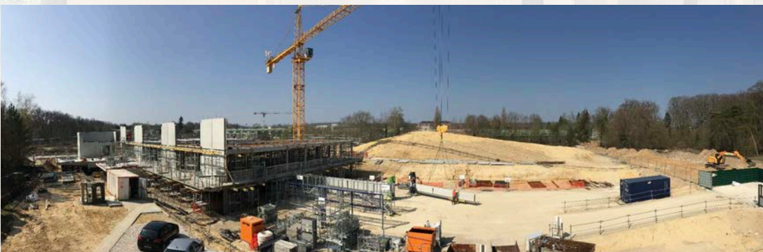
Vue d'ensemble - 01/04/2019